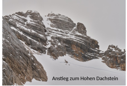
Anstieg zum Hohen Dachstein

gerade leichtem Gepäck. Gletscher- und LVS-Ausrüstung drücken auf den Rücken aber (noch) nicht aufs Gemüt. So steigen wir vorfreudig (und etwas übermütig) in (drei) unterschiedlichen Gruppen auf. Unsere Gruppe kämpft sich zunächst recht steil, viel später flacher aber dafür stets wellig bergauf und kam nach 4 h und 1200 hm Aufstieg an der ersten und (für uns!) einzigen heutigen Zwischenstation Gjaidalm schon recht erschöpft an. Die Nachtanreise zehrt! Nach kurzer Rast beginnt für uns die Wegsuche zum Wiesberghaus. Die versprochene Fahrspur verfehlen wir und erreichen schließlich einen mit Stangen markierten Weg (die Bärengasse, wie wir später erfahren). Nach weiteren 4 km mit 300 hm auf (und 150 hm ab) erreichen wir noch vor Sonnenuntergang eine ziemlich verlassen wirkende Hütte – das Wiesberghaus der Naturfreunde. Wir sind die ersten und einzigen Übernachtungsgäste. Es haben alle (Deutschen) Gäste) abgesagt. Die Wetterprognose fürs Wochenende sei zu schlecht. Eine Kaltfront ist für Samstag angekündigt (endlich wieder?) reichlich Neuschnee soll auch dabei