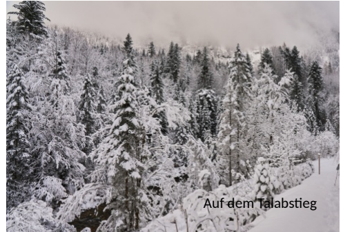
Auf dem Talabstieg

Hintermannes. Das ist ein recht schweißtreibendes Unterfangen, bei dem wir für eine echte Lawinenverschüttung wertvolle Erfahrungen sammeln können. Danach haben wir uns das Abendessen verdient. Sogar mit Harfenmusik und Gesang tragen zwei Mitglieder unserer Gruppe im Gastraum zur Unterhaltung bei.