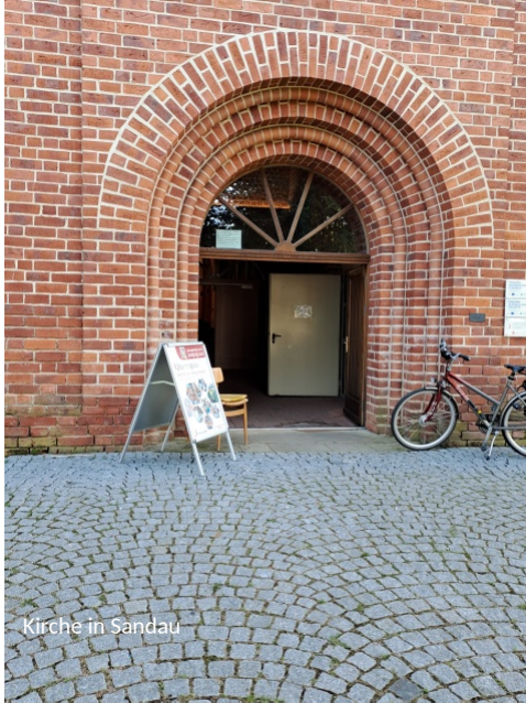
Kirche in Sandau