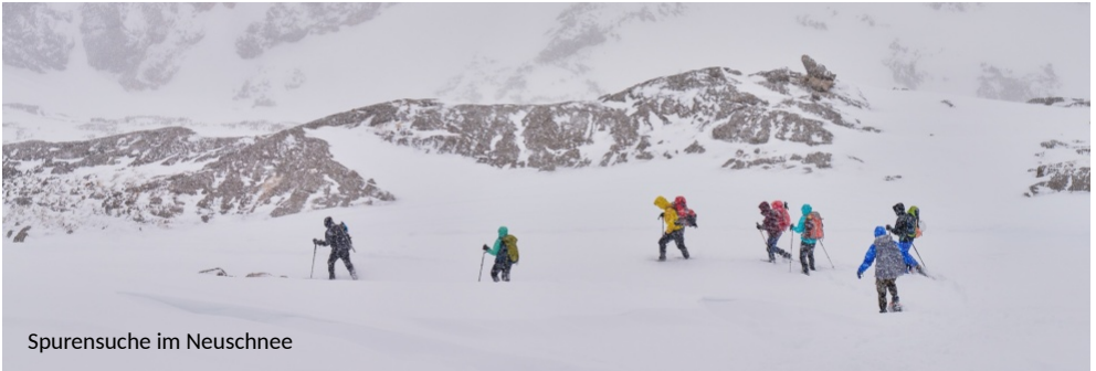
Spurensuche im Neuschnee

Tross. An der Dachsteinwarte in 2741 m Höhe pfeift uns eisiger Wind um die Nase. Belohnt werden wir dafür mit einem grandiosen Blick auf die Berggipfel der Umgebung. Nach einer Einkehr dürfen wir uns unserem nächsten Etappenziel bergab nähern, während die Tagesausflügler mehr oder weniger keuchend in großer Anzahl in die Gegenrichtung streben. Bevor wir dann an der Bergstation den Dachsteingletscher von innen bewundern dürfen, führt uns der Weg über eine Brücke in luftiger Höhe. Dort lohnt sich ein Foto auf der „Treppe ins Nichts“. Im Gletscher steht die nächste Überraschung in Form von vollendet schönen Eisskulpturen bereit. Zauberhafte Eisswelt! Da genug Zeit ist und wir uns gut erholt fühlen, haben wir uns noch einen Abstecher zum Kleinen Gjaidstein (2734 m) gegönnt. Gut gelaunt erreichen wir dessen Gipfel ohne Schneeschuhe dafür mit leichter Kletterei. Von oben halten wir Ausschau nach einer Möglichkeit, über den schneebedeckten Gletscher zurück zur Simonyhütte zu laufen, unserem heutigen Tagesziel.