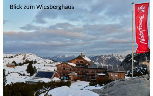
Blick zum Wiesbergghaus

Die Vielfältigkeit dieser Tour soll auch mit einer Vielfalt an Autorperspektiven zum Ausdruck gebracht werden. Diesen und den nachfolgenden Teil schildert zunächst Marcel: Wir erwarten für den Aufstieg weit über 1000 hm auf über 11 km Aufstiegsmarsch mit nicht