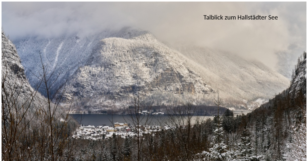
Talblick zum Hallstätter See

Hinweis: Die nächste Schneeschuh-Wanderung der Hochtourengruppe findet in 2024 über ein verlängertes Wochenende Ende Februar/ Anfang März statt. Interessenten melden sich bitte frühzeitig (über die Website)!