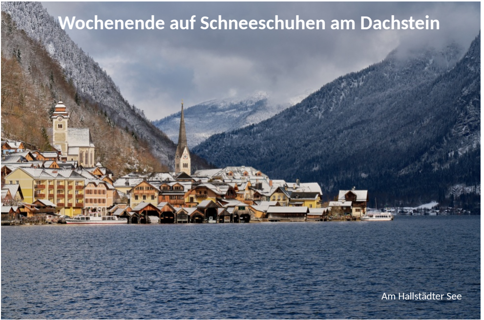
Am Hallstätter See

Als wir zur diesjährigen (2023) Schneeschuhtour am letzten Februarwochenende aufbrechen ist uns bewusst: den langen Unterhosen und warmen Handschuhen kommt diesmal mehr Bedeutung zu als der Sonnencreme. Die Anreise in der Donnerstagnacht erfolgt in unterschiedlichen Fahrzeugen (per PKW und/oder Bahn) aus unterschiedlichen Richtungen mit einem gemeinsamen Ziel: Obertraun, herrlich gelegen am Hallstätter See im oberösterreichischen Salzkammergut, erreichen wir am späten Vormittag. Es ist zur Ankunftszeit, wie so viele Skigebiete umgeben von grün-braunen Hängen und wirkt eher herbstlich. Ein schmaler weißer Streifen Skipiste schlängelt sich bis zur Talstation und dort tummeln sich auch recht zahlreich Skifahrer. Große Gegensätze prägen derzeit die Skiregion. Das Skigebiet Dachstein-Krippenstein bietet die längste Talabfahrt Österreichs, das Gletscherskigebiet „oben“ am Dachstein ist aber wegen Gletscherrückgang diese Saison gesperrt. Dennoch bietet das bekannte Skitourengebiet Dachstein mit zahlreichen gespurten Ski- und Schneeschuhwegen viele verschiedene Möglichkeiten sich gemäß den individuellen