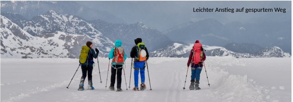
Leichter Anstieg auf gespurtem Weg

Draußen geht es ähnlich erfreulich weiter. Die Sonne kommt vor und zeigt uns die Route entlang gut gespurter Wege. Erstes Etappenziel ist die Dachsteinwarte. Unterwegs stößt noch einer der „Umwegler“ vom Vortag zu unserem